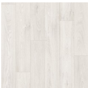
HAVANNA OAK 9

Ширина: 1,5/2,0/2,5/3,0/3,5/4,0 М Размерность дизайна: 1,5/2,0/2,5/3,0/3,5/4,0 М