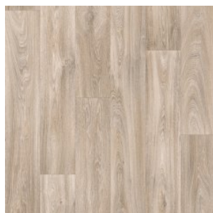
HAVANNA OAK 1

Ширина: 1,5/2,0/2,5/3,0/3,5/4,0 М Размерность дизайна: 1,5/2,0/2,5/3,0/3,5/4,0 М