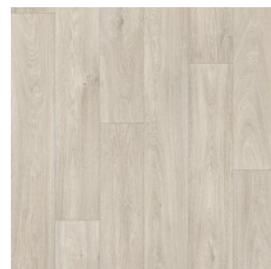
HAVANNA OAK 11

Ширина: 1,5/2,0/2,5/3,0/3,5/4,0 М Размерность дизайна: 1,5/2,0/2,5/3,0/3,5/4,0 М