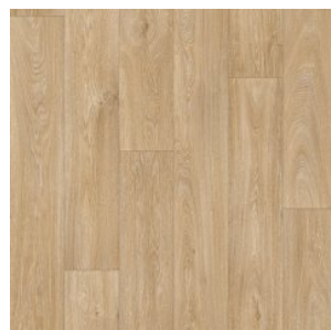
HAVANNA OAK 10

Ширина: 1,5/2,0/2,5/3,0/3,5/4,0 М Размерность дизайна: 1,5/2,0/2,5/3,0/3,5/4,0 М