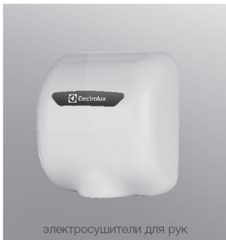
электросушители для рук